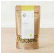
萩原農園の大豆菓子 with Beer ¥500