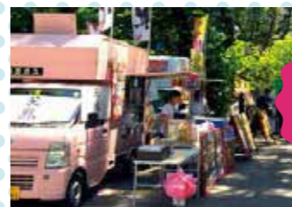
サウスコリドー キッチンカー「バリエーション豊富なおつまみ」

サウスコリドーに、キッチンカーが日替わりで登場！一品料理から、わいわい楽しめる盛り合わせメニューまでシーンに合わせてお楽しみください。