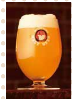
マーチエキュート神田万世橋 × 常陸野ブルーイング・ラボ 限定オリジナルビール -HANAYAGI- ¥680

常陸野ネストビールと、マーチエキュートがコラボレーションし限定のオリジナルビールを販売！ビール好き女子を増やすべく、希少なホップを使った心華やぐフローラルアロマと、苦味を抑えた後味。そして、小麦由来のやさしい甘みでさらりとした軽やかな飲み口がオススメポイント！