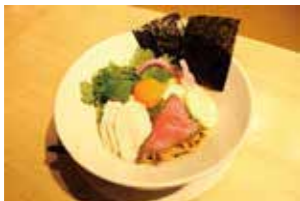
日本一のこだわり卵の濃厚まぜそば ¥850