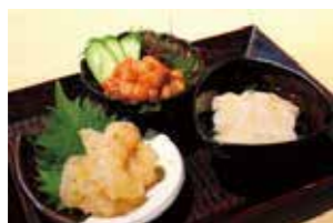
おまかせ塩辛3点盛 ¥980

塩辛全 60 種から日替り塩辛三種を厳選。ビールに、日本酒に合わせれば至福のひとつ。