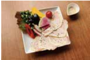
三元豚のオリジナルロースハムと山形ベジスティック ¥700

フクモリオリジナルの三元豚ロースハムと、山形から届いた新鮮な野菜をスティックで。