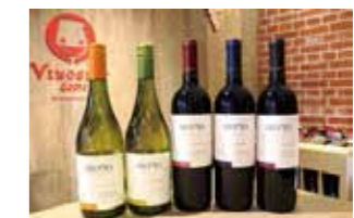
アロモ・シリーズ 各¥1,296

チリの果実味豊かな良品でおいしいお手頃価格のワイン。冷やした白ワインもございます。(※グラス貸出可)